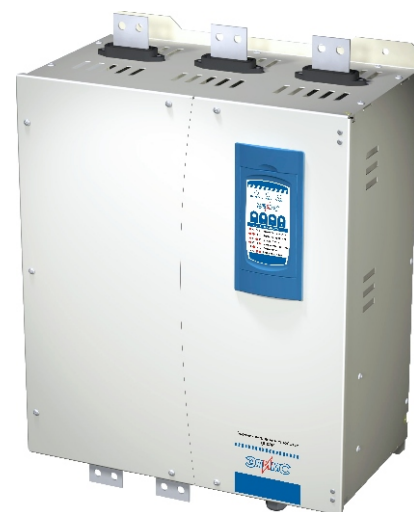
Внешний вид БПУФ

БПУФ имеет защиты от коротких замыканий (максимально-токовую), от перегрузки двигателя (время-токовую), перегрева тиристоров устройства, от перенапряжения на тиристорах. Устройство имеет входы для контроля тока статора, срабатывания вводного автомата, а также контакторов (подключающего и шунтирующего) Схема управления устройства выполнена с применением микроконтроллера. Предусмотрена возможность управления устройством кнопками, как с двери шкафа, так и с пульта дистанционно управления или подключения устройства в АСУ по каналу связи RS-485. Степень защиты устройства IP20 по ГОСТ 14254. Климатическое исполнение УХЛ4, УЗ по ГОСТ 15150.